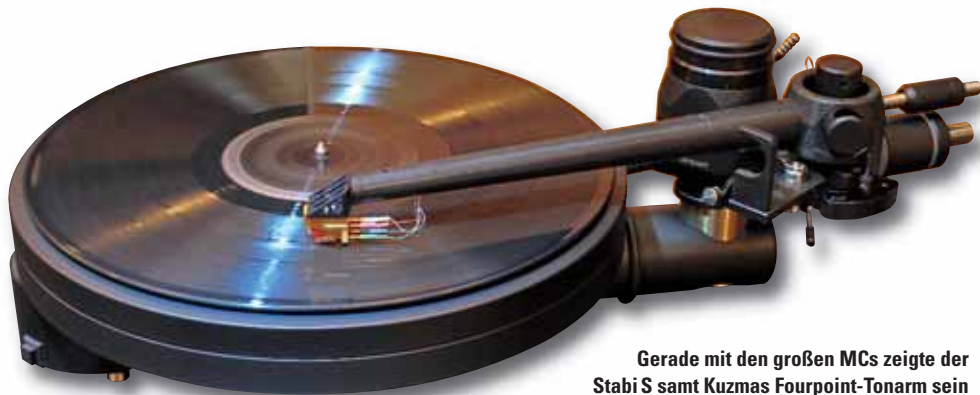
Gerade mit den großen MCs zeigte der Stabi S samt Kuzmas Fourpoint-Tonarm sein ganzes Können. An ihm liefen die Abtaster-Vergleiche.